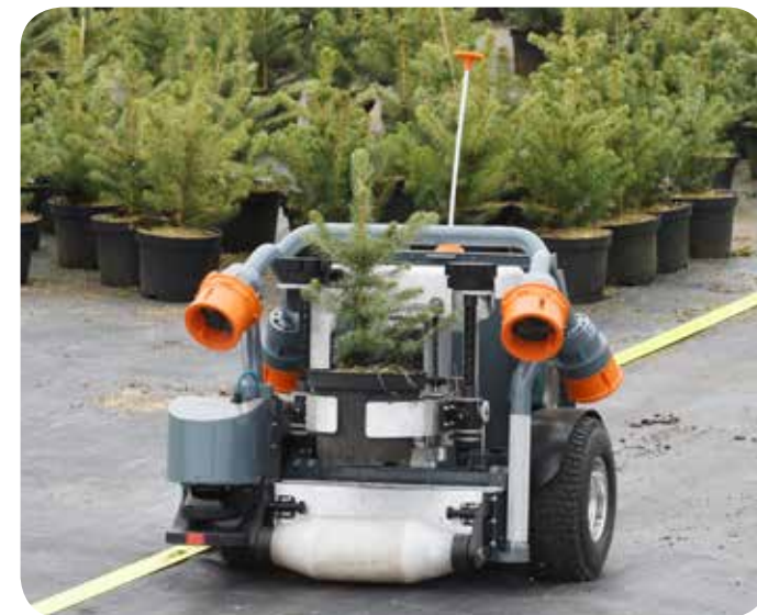
Применение робота HV-100 в питомнике